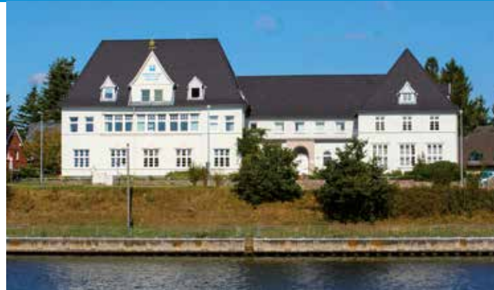
Tagungszentrum Martinshaus am Nord-Ostsee-Kanal

Ihr Bildungsurlaub wird vom Land Schleswig-Holstein gefördert! Alle Informationen hierzu: https://www.schleswig-holstein.de/DE/landesregierung/themen/ bildung-hochschulen/bildungsfreistellung-bildungsurlaub